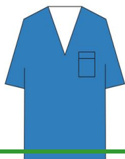
SERVIZIO IGIENE AMBIENTALE