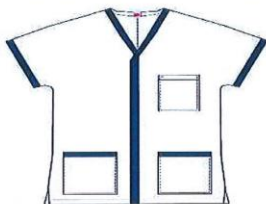
OPERATORE ADDETTO ALL'ASSISTENZA